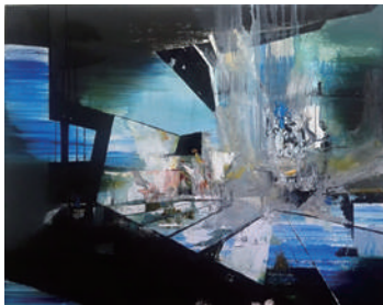
折笠 鈴 【すべての夜をおもいだす】 2024年、727×910