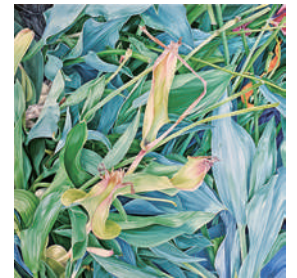
馬場 美桜子 【afterglow】 2023年、455×455