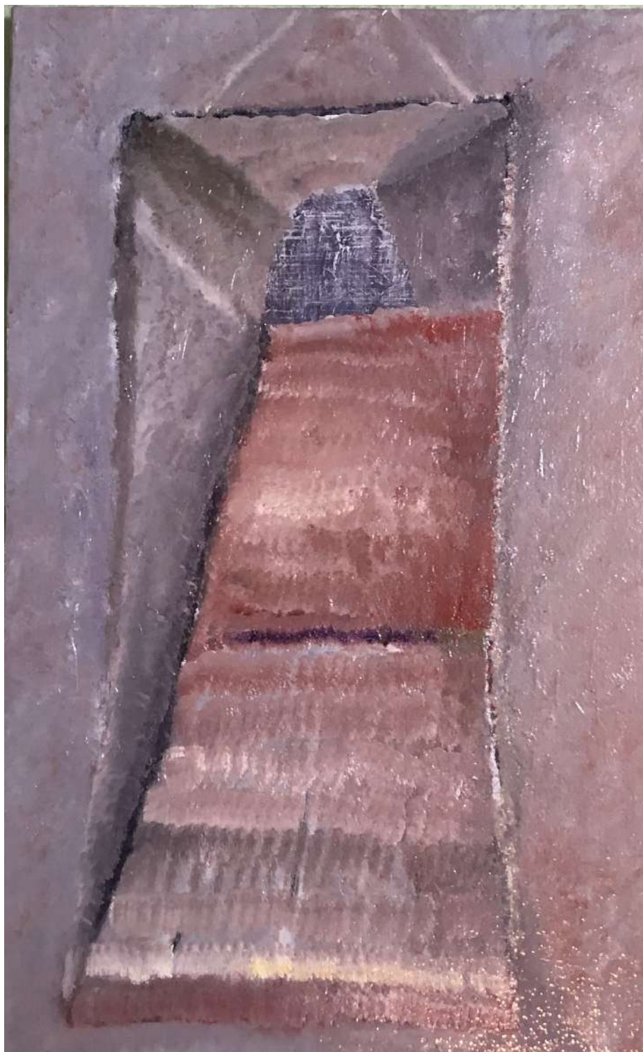
グランプリ：矢野 紗季 掛け軸