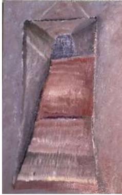
矢野 紗季 【掛け軸】 2024年、530×333