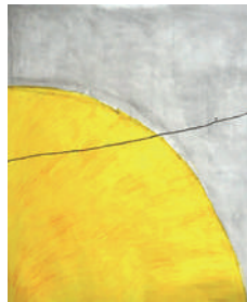
AKARI 【御仏】 2024年、895×790