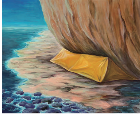
影山 萌子 【野宮3】 2024年、530×652