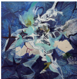
七篠 奈津美 【goodblue (よだかの星)】 2024年、606×606