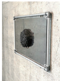
高木 謙造 【地球鋳型：反・慣性の岩】 2024年、850×850×200

入選者(50音順) 石田 浩美、石渡 由菜、井上 ひかり、江波戸 陽子、大城 舞華、桑村 まみ、鈴木 蒼空、Senn、高橋 優人、高橋 侑子、濱田 楓、 窓に自分全開己書道場 渡辺いくみ、三村 萌嘉、宮山 香和、森下 明音、李 燦辰、若尾 武幸