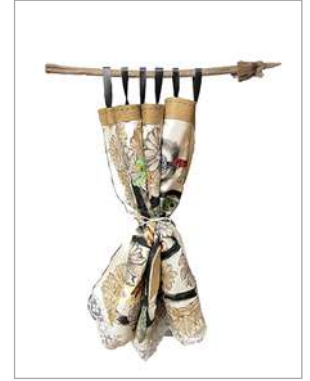
hellowakana 【trap#21】 2024年、650×400×15