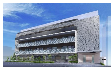
チャームスイート西新宿 完成予想図