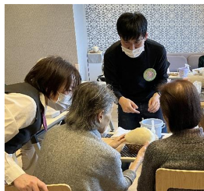
アートプログラムの様子

これまで作品募集に参加した若手アーティストによるご入居者様向けアートプログラムを開催し、継続した支援に取り組んでいます。アーティストの若い感性がご入居者様の意欲とQOL向上に働きかけ、また若いアーティストにとってはコミュニケーションと新たな創作活動の原動力となるよう引き続き取り組んでまいります。