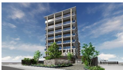
チャームスイート神戸垂水 完成予想図