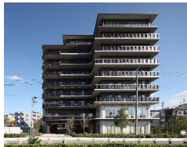
チャーム新大阪淡路 外観