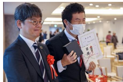
笑顔いっぱいな入選者の方