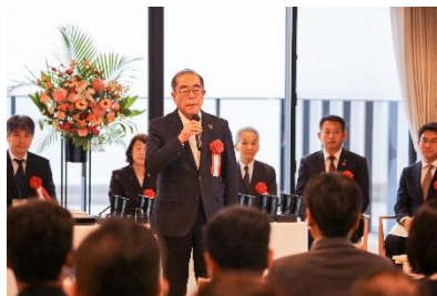
下村会長兼CEOより挨拶