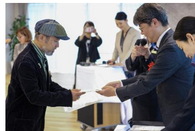
小堀社長兼COOより表彰状と賞牌、賞金目録を授与